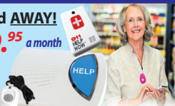
This Button SAVES Lives! As Shown GPS, Lowest Price Guaranteed!

CALL NOW! 800.809.3352 GPS Tracking w/Fall Detection Nationwide, No Land Line Needed EASY Set-up, NO Contract 24/7 365 Monitoring in the USA MDMedAlert Safe-Guarding America's Seniors Nationwide!